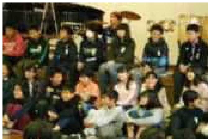
各学年の出し物に笑顔こぼれる6年生

1年生から5年生が、間もなく卒業する6年生へ感謝の気持ちを伝える日です。1年間の縦割り班の活動は、この日のためにあると言っても過言ではないでしょう。そして、6年生から5年生へと重いバトンが引き継がれるのも、この日と言ってよいでしょう。子どもたちにとってとても意味のある行事です。