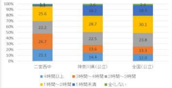
(12) 平日に1日当たりのテレビゲーム(携帯・スマホ)の時間