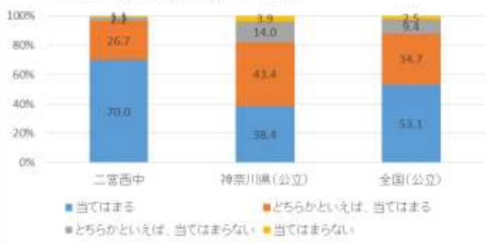
(63) 1, 2年のときに受けた授業では、授業のはじめに目標(めあて・ねらい)が示されていたと思う