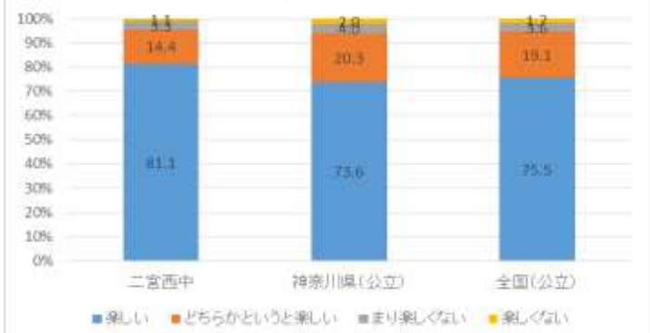
(36) 学校で友達に会うのは楽しい