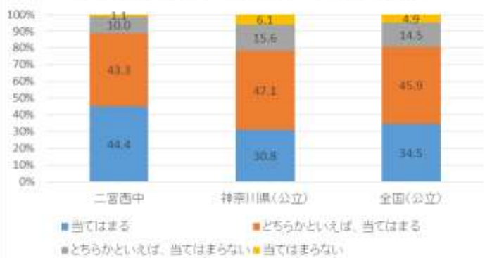
(28) 先生はあなたのよいところを認めてくれていると思う