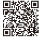
(町のホームページ)

町施設を利用してイベント等を開催される主催者の方にも、同様の対応をお願いしています。