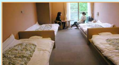
宿泊部屋イメージ 冷暖房・大浴場完備！