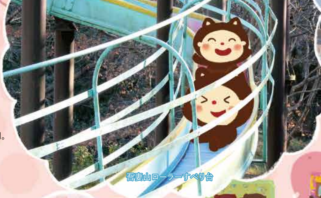
吾妻山ローラーすべり台