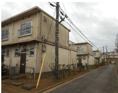
建替えが決まったテラス

神奈川県は県営テラス（二宮団地、百合3）の建替えに際し、広域活用型のコミュニティルーム、コミュニティ広場を設ける。現テラスを健康団地として更新する説明の中で明らかになったもので、すでに基本設計に着手した。完成は数年先になるが、百合が丘地区での新たなコミュニティスペースの誕生は地域活動にも影響を与えそうだ。