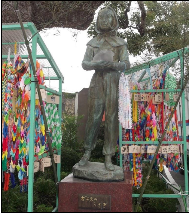
千羽鶴で飾られたガラスのうさぎ像