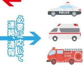
警察・救急・消防