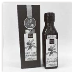
「湘南オリーブ エキストラバージン」 ㈱かねきち