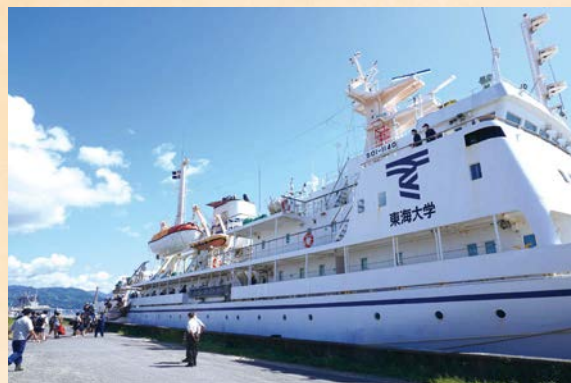
☎ 生涯学習課生涯学習班(☎72-6912)