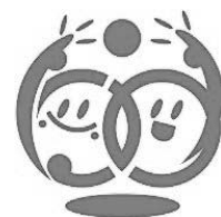
二宮町男女共同参画 シンボルマーク