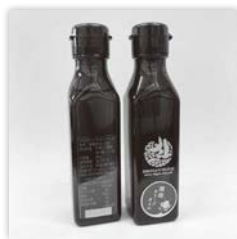
「湘南オリーブエキストラバージンオイル」 ㈱ファームヴィレッジ湘南