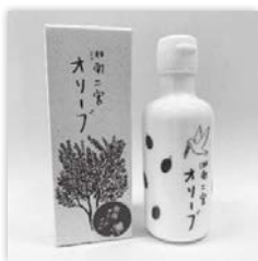
「湘南二宮オリーブ」 ㈱ユニバーサル農場

地域団体商標は地域で生産される特産品に対して「地域ブランド」として品質などを保証するものです。町では、湘南オリーブオイルに関連する商品などの販売促進をはじめ、地域の知名度獲得などPR活動を進めて町の観光産業の拡大や地域経済の活性化につなげていきます。