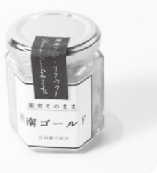
② 果実そのまま 湘南ゴールドマーマレード