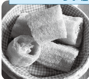
⑥ エコグッズの代表！ 万能へちまたわし