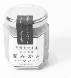
③ 果実そのまま 夏みかんマーマレード