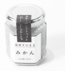
④ 果実そのまま みかんマーマレード