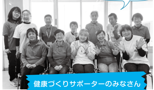
健康づくりサポーターのみなさん

健康づくりサポーターは、「地域の通いの場」などで介護予防・健康づくりのお手伝いをしています。