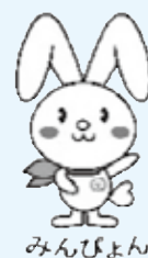
神奈川県民生委員児童委員協議会のキャラクター「みんびよん」