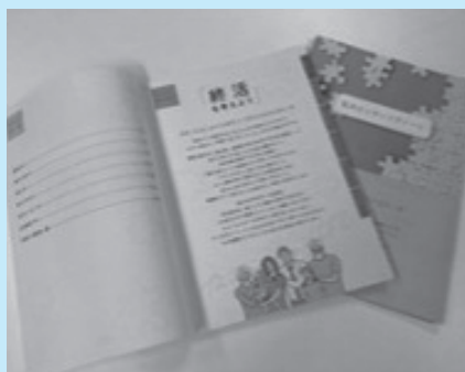
図 高齢介護課高齢福祉班(☎75-9542)

これからの人生を、もっと自分らしく過ごすため、大切な人へのメッセージや、もしものときに伝えたいことを書き残しておくことで、残される人の安心にもつながります。