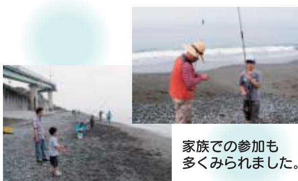
家族での参加も多くみられました。

当日は、途中から降り出した雨により時間を繰り上げて競技終了となりましたが、多い人では10匹以上の白ギスを釣りあげていました。