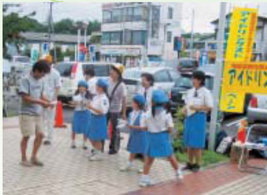
ガールスカウトがお出迎え

地球温暖化を防止するため、6月17日(日)に西友二宮店で実施されました。みなさんも環境だけでなく、家計にもやさしいエコドライブを今すぐ実行しましょう。