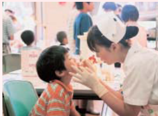
ちよつと緊張「あーん」

今回から会場がラティアンになった「歯づくりフェア」には、親子連れをはじめ、多くの方が訪れました。