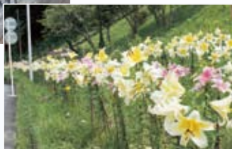
(写真右) 公園の斜面で咲きほこるユリ

ユリの里づくりを進める百合が丘・一色生涯学習推進会では、今年も地域の方に広く楽しんでいただこうと、合計500株以上を公園やふるさとの家などに植えたり、プランターに植えたユリを児童館や防災コミュニティーセンターなどの地域施設に置いたりしました。