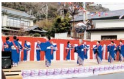
吾妻さんよさこいパレードにて

さまざまな団体・スポーツ が増えているなか、当協会では 盆踊りやよさこいなど、四 季を通して行事にちなんだ曲 を踊っています。