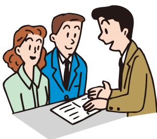
一度病院窓口で支払う方は、後日役場まで申請を。

毎月月末締切で、お預かりした月の2か月後に、登録された口座へお支払いします。 ※高額療養費等の調査で、2か月以上かかる場合もあります。