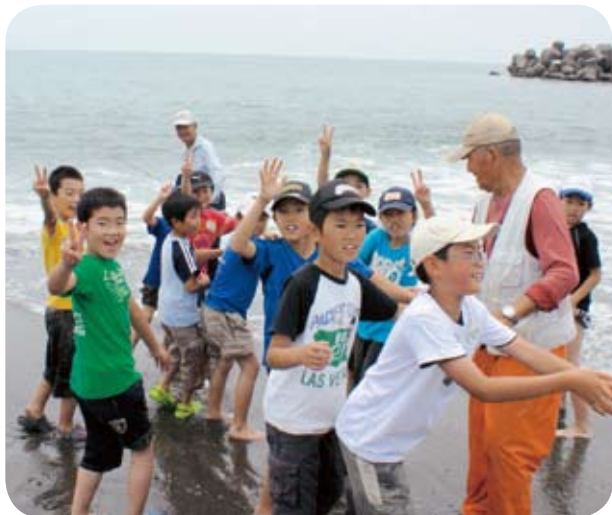
地引き網などで交流。「海ってすごく面白い！」と高山村の子どもたちも大はしゃぎ!

7月4日、地区長連絡協議会主催で町と地域間交流をしている長野県高山村の親子が来町しました。