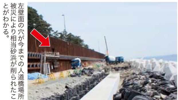
左壁面の穴が今までの人道橋場所とがわかる。