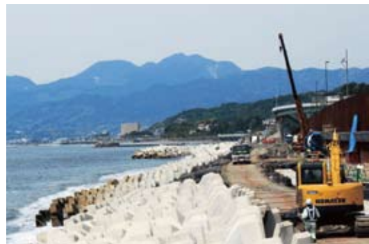
現在の二宮海岸。バイパスの工事のため、波消しブロックが何重にも設置されている。