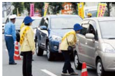
ヤオハン前のキャンペーン (7月14日)

「毎年本当に素晴らしいですね。いつも楽しみにしています。」という声も聞かれました。