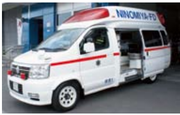
この4月に日本自動車工業会から車体が寄贈された新しい救急車。