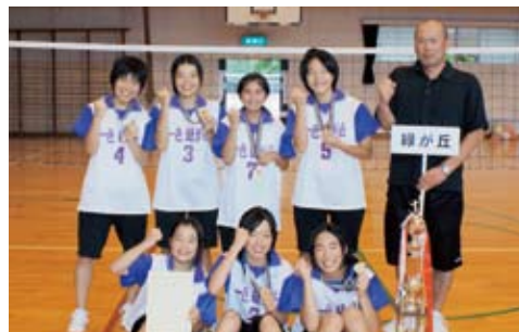
女子の部優勝 緑が丘Bチーム