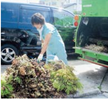
剪定枝を収集する作業員

が1トあたり2万2000円（3万6000円かかります。剪定枝等の堆肥化処理費用は、1トあたり1万6000円となります。剪定枝等を堆肥化することで、環境にやさしい資源化を進められるだけでなく、処理費用も削減できたとになります。