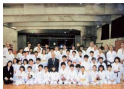
平成21年度3月演武会にて

年間には、夏の合宿、年の 終わりと始めには豚汁やお汁 粉のふるまい、春には演武会 を行っています。 ご興味をお持ちの方は、稽 古時、いつでもご見学くださ い。お待ちしております。