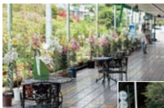
(写真左) 毎年恒例の鉢植えユリの鑑賞会