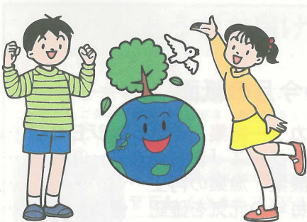
レッツ、エコライフ！