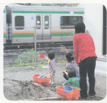
すぐ目の前を、子どもが大好きな電車が通過します！

5月7日(金) 駅南口 栄通り商店街内 駅周辺の活性化と子育て支援のため、駅南口商店街内に栄通り子育てサロンがオープンしました。 オープン初日は、栄通り商店会によるポップコーンなどの無料配布があったほか、「ぼこ・あ・ぼこ」が出演し、来場者を盛り上げていました。 この日は50組以上の親子が来場し、神奈川県産木材を使った新しいサロンと催しを楽しんでいました。 駅に近く、外遊びもできる栄通り子育てサロンをぜひご利用ください。 ◆ 育児相談もできます。 ☎ 71-1120