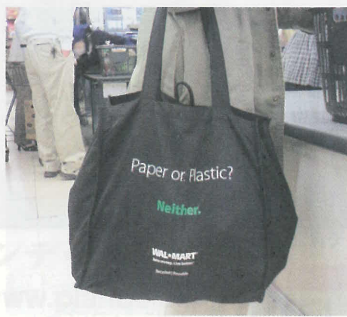
買い物にはマイバッグ持参！

エコバッグの活用や食べ残さないなど、ごみを出さない工夫は、心がけ次第で簡単にできます。