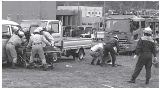
あらゆる現場に対応する救助工作車を使った救出(過去の訓練)