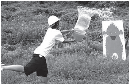
地域の中学生は重要な地域防災の担い手です