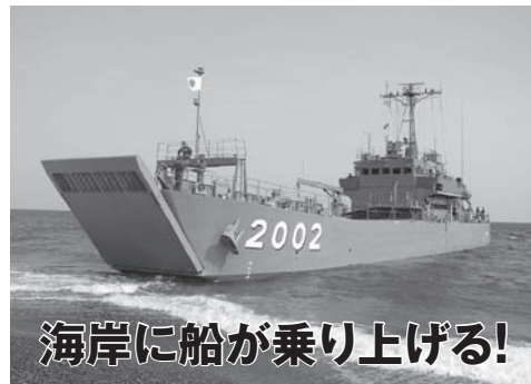
海岸に船が乗り上げる!

大規模災害で、道路や橋の崩壊などにより陸路が寸断された場合、町への物資輸送手段として海からの陸揚げが考えられます。 7月25日(日)の総合防災訓練(第1部)では、災害救助のスペシャリストである陸上自衛隊のほか、普段の訓練ではあまり見られない海上自衛隊の協力により、二宮初となる物資や人員の陸揚げを含めた大規模訓練を実施します。