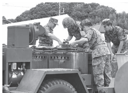
野外炊具車両による調理