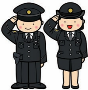
皆さんと一緒に、安全をつくります！

「駐在さん」は町に住みながら警察として地域の安全・安心を守る「地域の人」です。 皆さんも地域の駐在さんとともに、生活の安心をつくるため、あいさつから始めてみませんか？