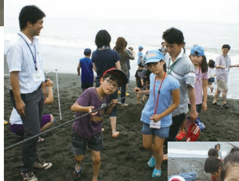
大人も子どももみんなで力を合わせて地引き網をしました。

(写真右)手に持っているのは「あさり」。模擬潮干狩り体験ではいっぱいとれて「満足」な笑顔が見られました。