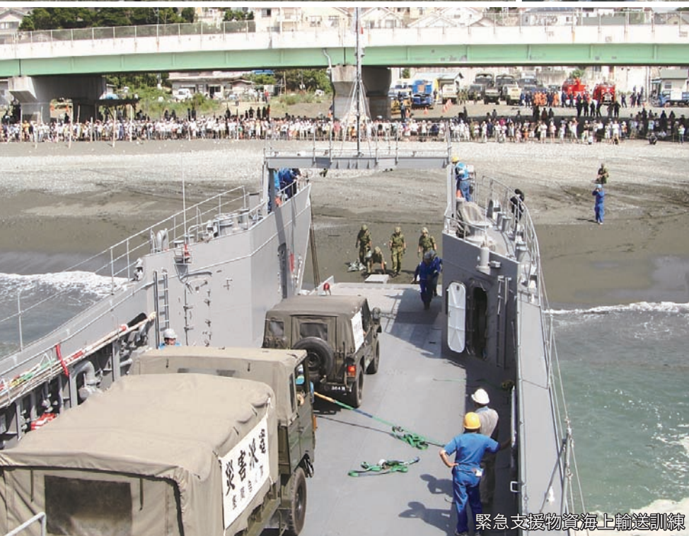
緊急支援物資海上輸送訓練