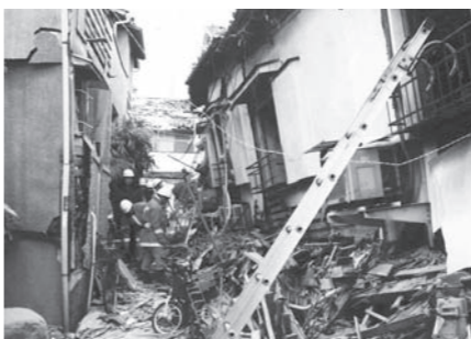
当町消防職員による救出活動

公的援助が届くまで3日間かかるといわれています。それまでの食料や衣類、応急医療品などは各自で準備しておく必要があります。