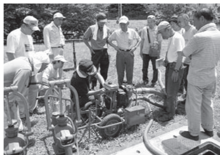
一色地区の自主防災訓練の様子

予想状況 家や事務所の中は予想以上に散乱し、なにがどこにあるか分からない状態になります。