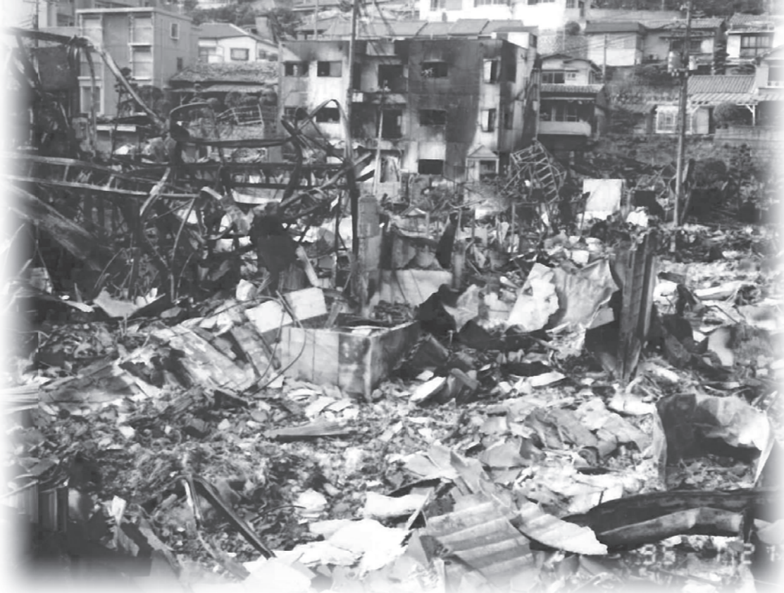
阪神・淡路大震災の広域応援活動に従事した、当町消防署職員撮影の神戸市内