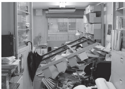
地震で散乱した事務所

阪神・淡路大震災では、家具の下敷きになり、けがをしたり、亡くなったたりした方が多く報告されました。