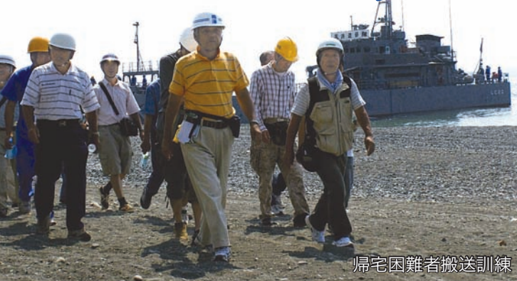
帰宅困難者搬送訓練