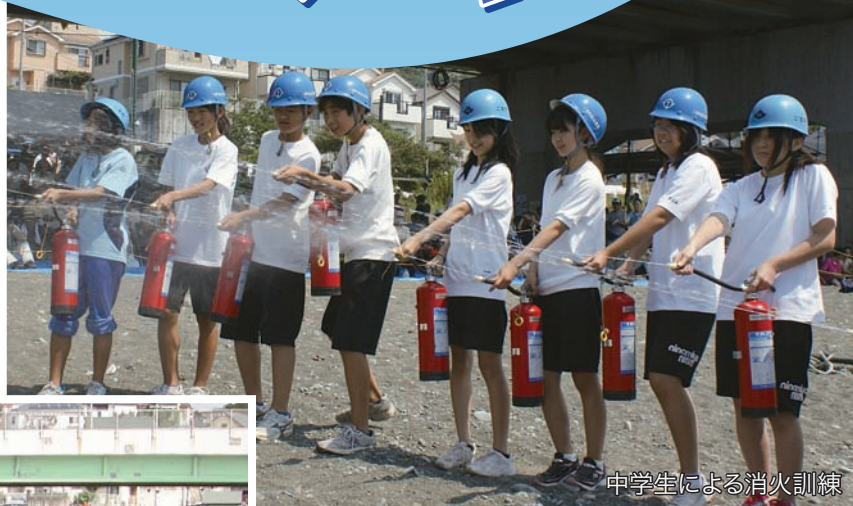
中学生による消火訓練