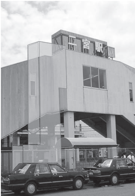
新しく設置されるエレベーターの 設置予定場所（北口側）

出でできるよう、特に駅周辺 のバリアフリー化を「交通 バリアフリー基本構想」(平 成19年度策定)に基づいて 進めています。