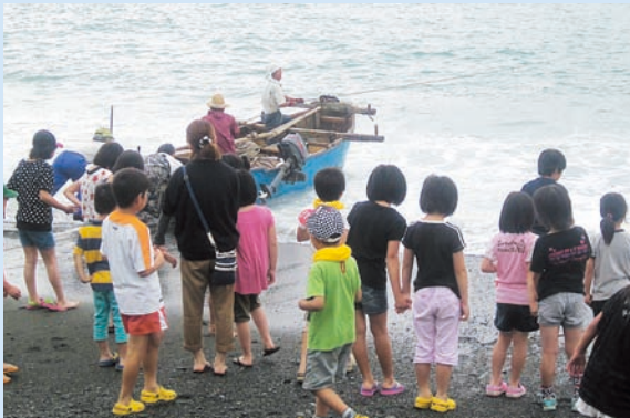
網を仕掛けにいく漁師さんたち。 お魚たくさんとれますように！