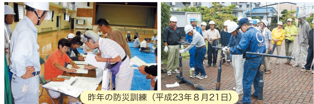
昨年の防災訓練(平成23年8月21日)

※訓練中は、防災行政無線やサイレンが流れます。災害と間違えないように注意してください。 ※中止の場合は、防災行政無線で7時と7時30分の2回お知らせします。