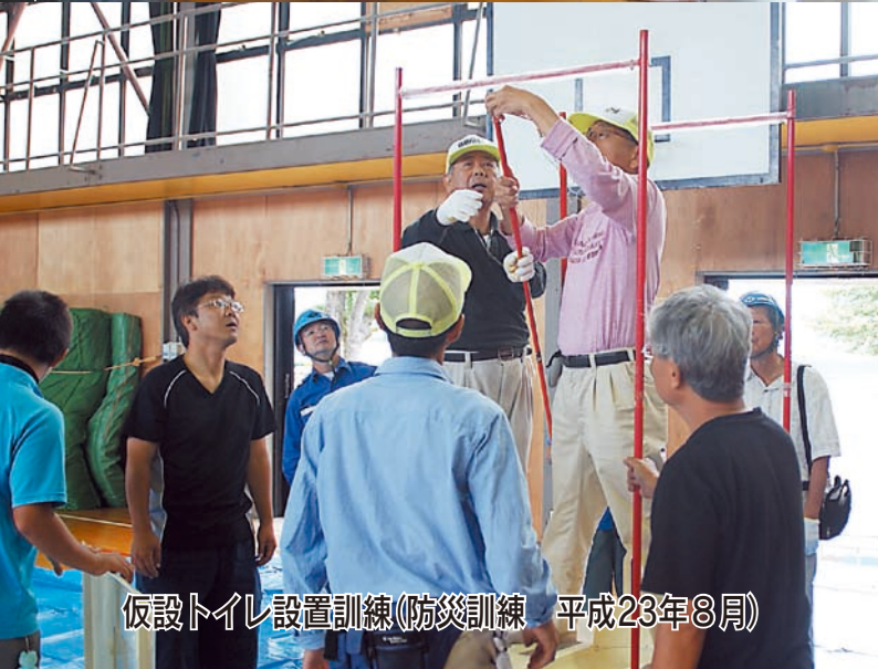
仮設トイレ設置訓練(防災訓練 平成23年8月)