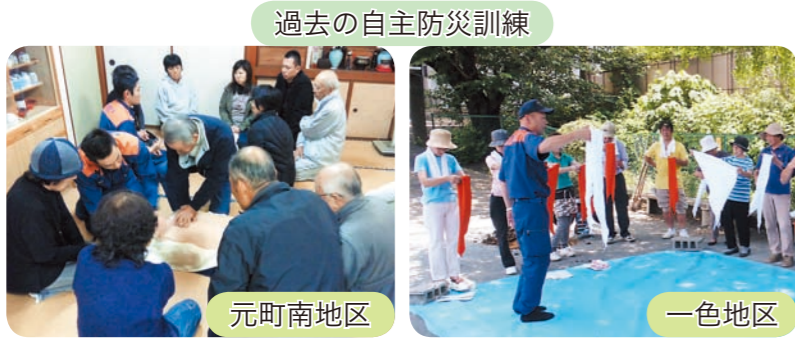
過去の自主防災訓練