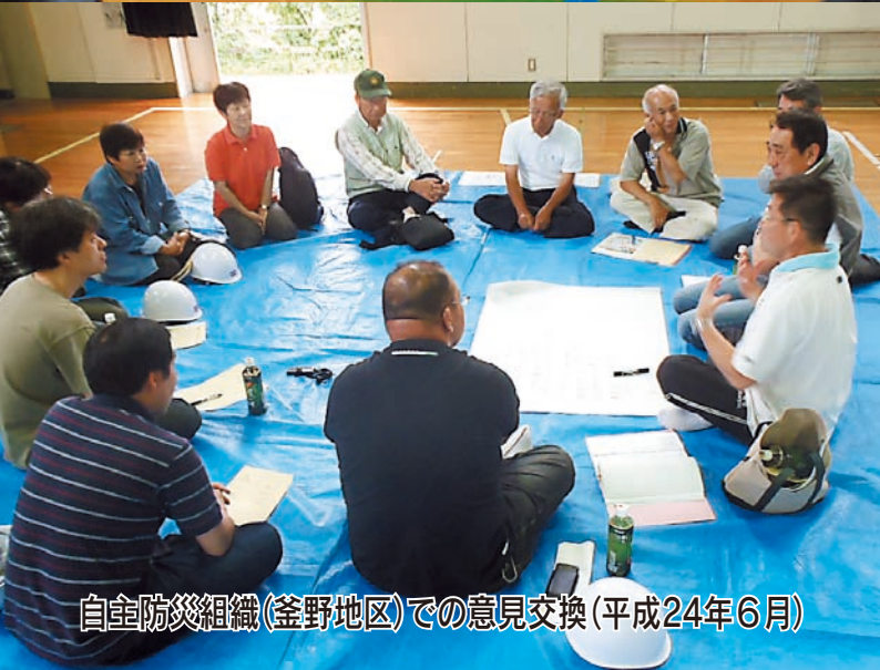
自主防災組織(釜野地区)での意見交換(平成24年6月)