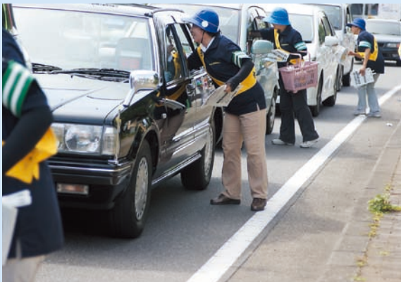
マックスバリュ前の県道を通過する車両に対して、啓発物品を配布するなどキャンペーンを実施し、交通事故防止を呼びかけました。