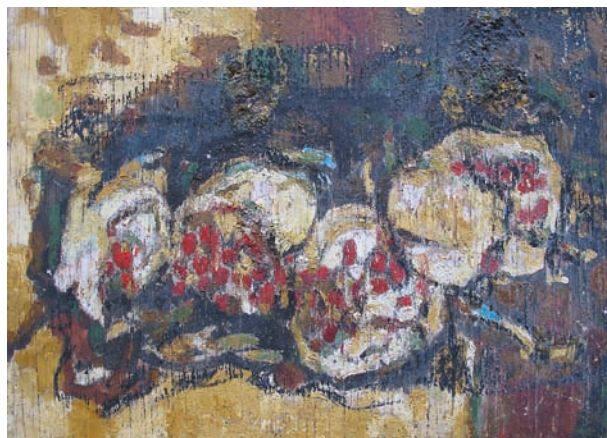
ざくろ 「柘榴」(制作年不明) 縦23.7cm×横33cm 技法:油彩 材質:板