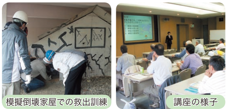
模擬倒壊家屋での救出訓練