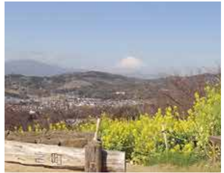
吾妻山からの富士山