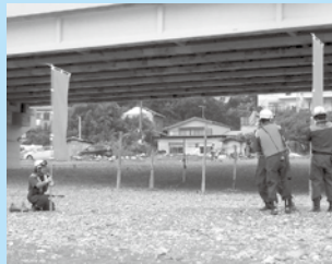
オレンジフラッグの掲出訓練