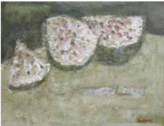
「西瓜」(1970年制作) 縦 30.0 cm × 横 40.0 cm 技法: 油彩、材質: 板

利節独特のマチエルと淡い色彩で描かれた3切の大きさの異なる西瓜が丸いテーブルの上におかれています。