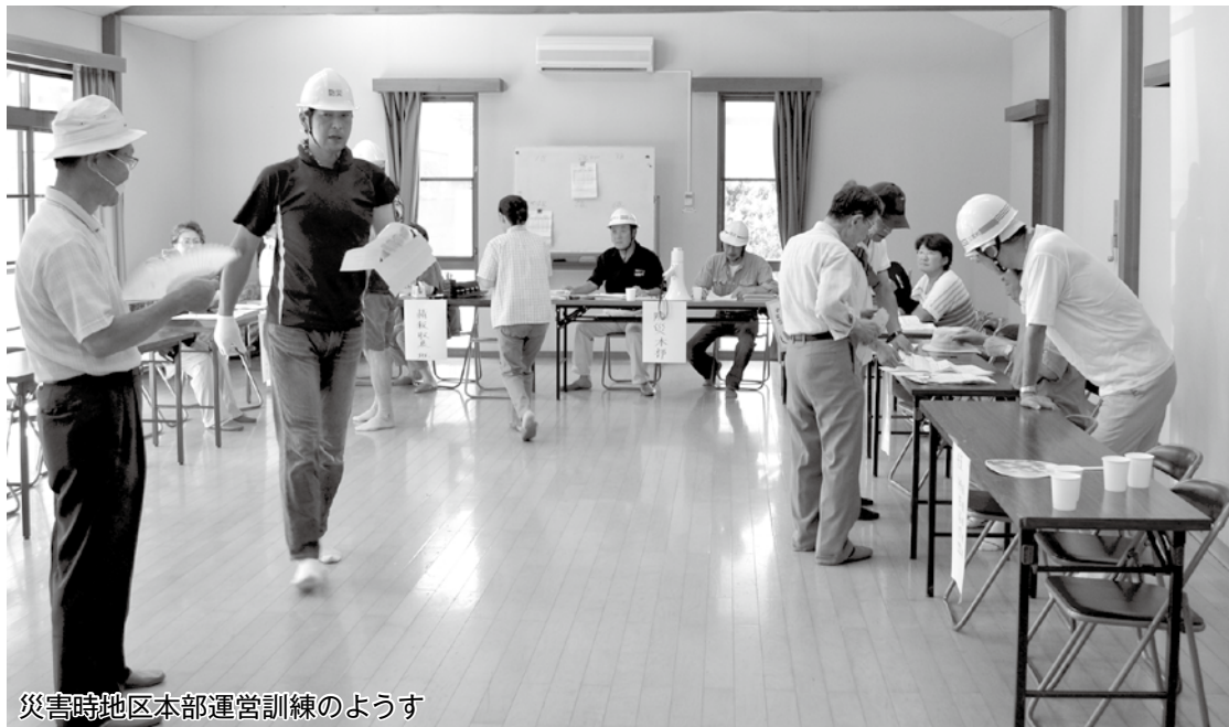
災害時地区本部運営訓練のようす