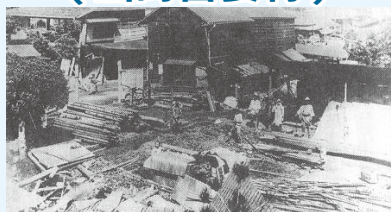
震災後の状況(元町)

「突如として大地が震動した。家はガラガラと崩壊し、火焰は渦巻いて起こった。烈風は猛火を煽りたてた。炎々たる紅蓮の焰は市街地へ飛んで全都さながら火の海と化した。」