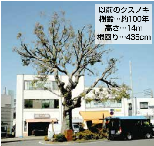
以前のクスノキ 樹齢…約100年 高さ…14m 根回り…435cm

駅南口に植えられていたクスノキは、ガラスのうさぎ像と共に駅前のシンボルとして親しまれてきました。しかし、樹齢が100年を超えており、平成24年6月に樹木医が診断したところ、多くの部位で腐朽が確認され、空洞化していることが分かったため、3月中旬に伐採し、新たなクスノキを植えました。