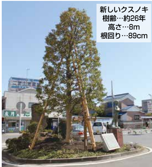
新しいクスノキ 樹齢…約26年 高さ…8m 根回り…89cm

駅南口に植えられていたクスノキは、ガラスのうさぎ像と共に駅前のシンボルとして親しまれてきました。しかし、樹齢が100年を超えており、平成24年6月に樹木医が診断したところ、多くの部位で腐朽が確認され、空洞化していることが分かったため、3月中旬に伐採し、新たなクスノキを植えました。