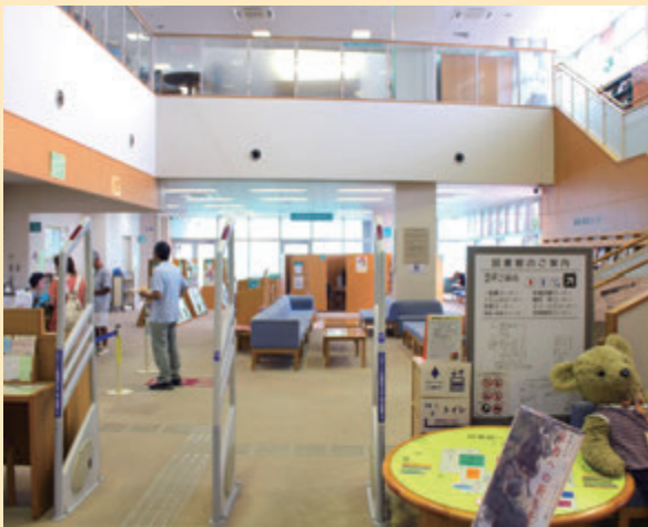
図書や資料などが充実した図書館

福祉事業における各種計画の策定及び改訂 …1,167万円 妊婦健康診査補助の拡充……………773万円 図書館運営・資料整備事業……………4,086万円 子育て支援の促進(一時預り事業の拡大など) …907万円