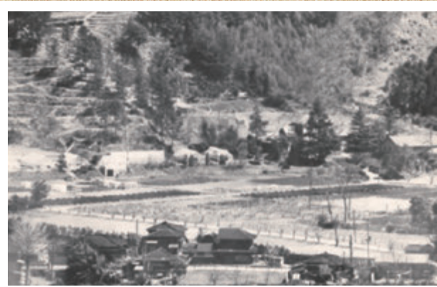
旧神奈川県園芸試験場周辺