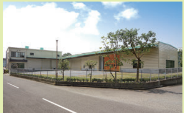
10月1日より稼働しているウッドチップセンター