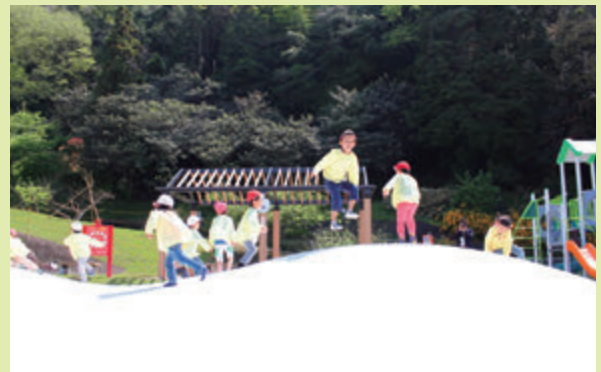
公園専用駐車場もあるラディアン花の丘公園

(仮称)風致公園整備事業……………7,000万円 ※現・ラディアン花の丘公園 (仮称)剪定枝資源化施設整備事業 ……8,815万円 ※現・ウッドチップセンター 町民活動推進補助金の拡充……………54万円