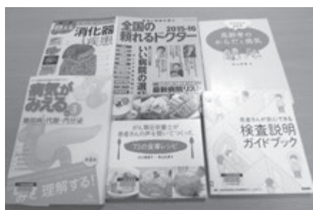
健康・医療関連図書