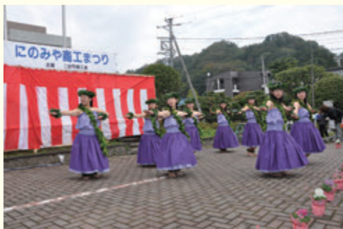
図 産業振興課商工観光班、二宮町観光協会 (☎73-1208)