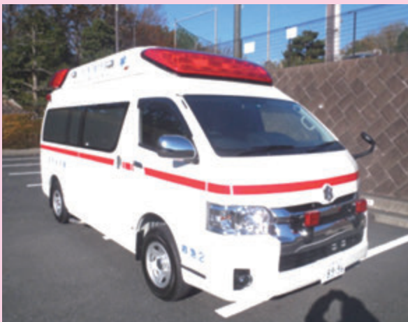
更新した高規格救急自動車

駅周辺整備計画事業……………926万円 高規格救急自動車購入事業……………2,747万円 街路照明灯LED化……………638万円 地域公共交通推進事業……………142万円