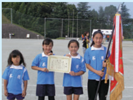
〈女子の部〉 優勝 茶屋Aチーム