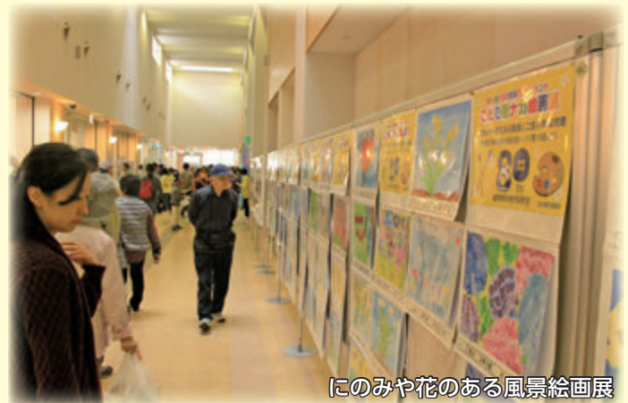
にのみや花のある風景絵画展