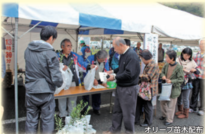
オリーブ苗木配布