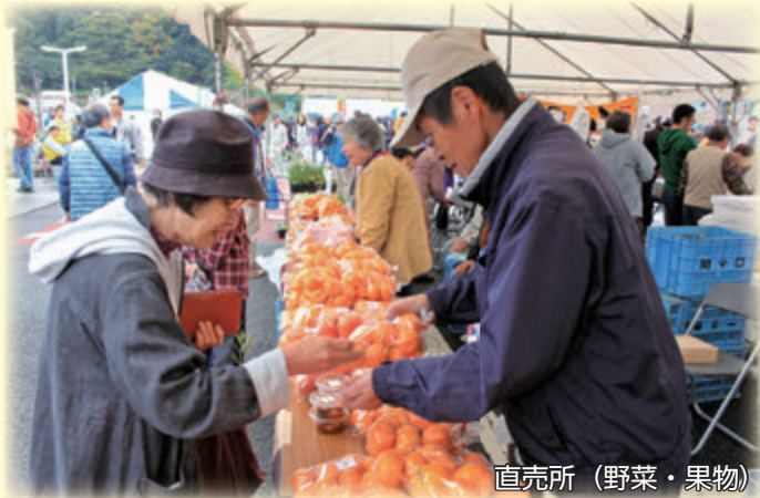
直売所 (野菜・果物)