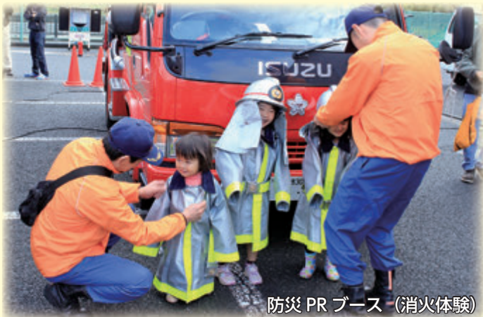
防災 PR ブース (消火体験)