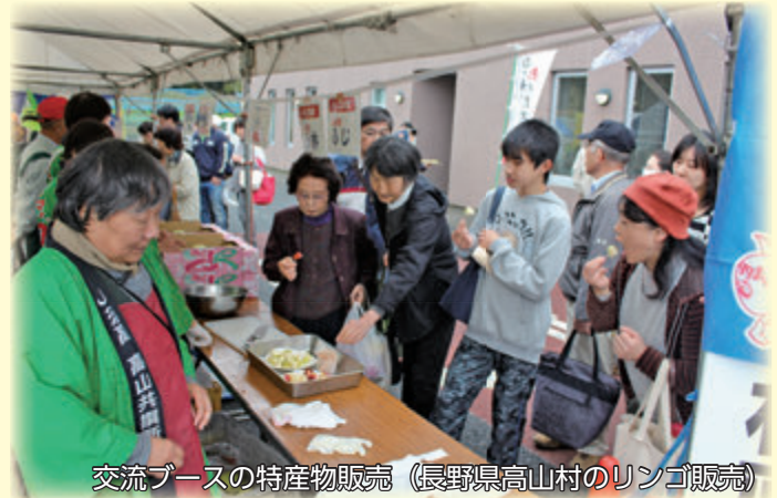
交流ブースの特産物販売 (長野県高山村のリンゴ販売)