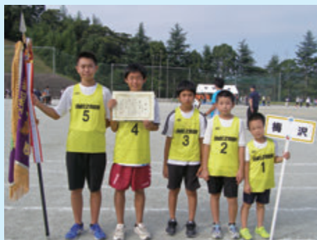
〈男子の部〉 優勝 梅沢チーム