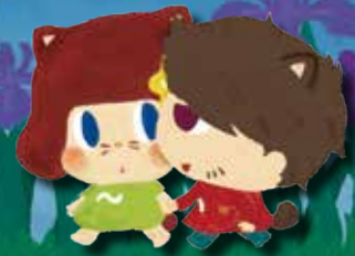
せせらぎ公園【ホテルの鑑賞会】 5/23(木)~29(水) P.6

これと同様に、より良いまちづくりのための事業を推進するために、さまざまな事業を計画に位置づけています。