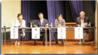
3/9開催「県生活支援サービス担い手養成研修」