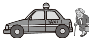
選挙管理委員会事務局