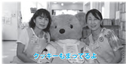
クッキーもまってるよ