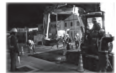
あまり車が通らない真夜中に工事をすることもあるよ。