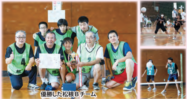
優勝した松根Bチーム

3回目となる地区対抗バウンズボール大会が開催され、17地区から28チームが出場。