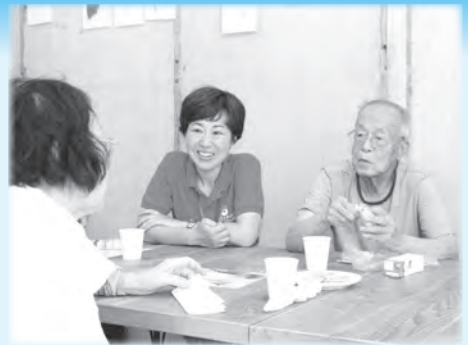
いつもカフェ内は笑顔いっぱいの雰囲気

お茶を飲みながら、認知症にかかわる相談や情報共有ができるこの空間に入ってみませんか。