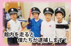
館内を走ると 僕たちが逮捕します!

2/9㊧、ラディアンで開催された同イベントは、町子ども会育成会連絡協議会主催によるもので、各地域の子ども会に所属する小学校5・6年の児童たち(リーダー48名)が、秋頃からの日でも準備を進め、まさに「子どもがつくる、こどものまち」として誕生しました。