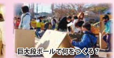
巨大段ボールで何をつくる?