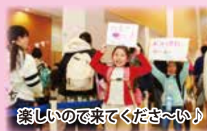
楽しいので来てくださ〜い!