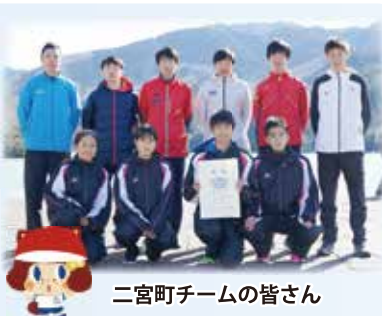
二宮町チームの皆さん

2/9㊨、県内19市11町の各代表選手が、秦野市カルチャーパークから相模湖までの51.5kmの道のりをタスキでつなぎました。町村の部の連覇をかけて臨んだ第74回駅伝は惜しくも2位でしたが、2時間48分9秒の好記録は市代表も抑えて全体13位の大健闘のレースとなりました。次回大会での「町村の部V奪還」に、今から期待が膨らみます。選手・スタッフの皆さん、お疲れさまでした。