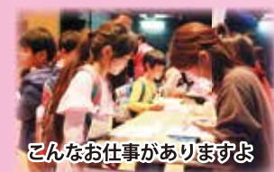
こんなお仕事がありますよ