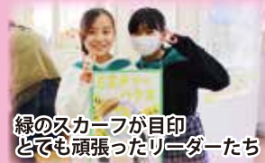
緑のスカarfが目印 とても頑張ったリーダーたち

2/9㊧、ラディアンで開催された同イベントは、町子ども会育成会連絡協議会主催によるもので、各地域の子ども会に所属する小学校5・6年の児童たち(リーダー48名)が、秋頃からの日でも準備を進め、まさに「子どもがつくる、こどものまち」として誕生しました。