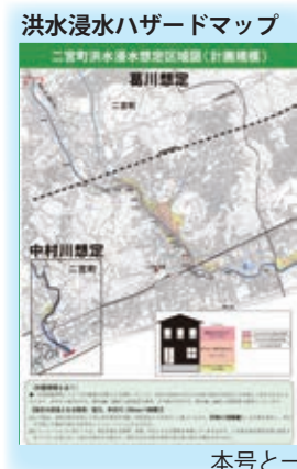
洪水浸水ハザードマップ

それに伴い、町でも、 新たなハザードマップを作成 しましたので、自宅周辺の浸水区域などについて、見直しされた計画規模はもちろん、想定最大規模についても確認しましょう。