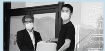
4、5月に配布した次亜塩素酸水は、AFURI株式会社から無償で提供していただいたものです。