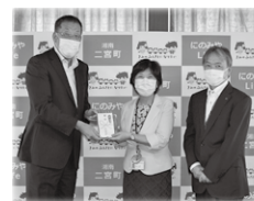
ヤオマサ株式会社様