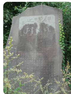
伊達時彰徳碑 (二宮駅南口)

詳細は、「ふるさと再発見7 伊達時とその時代」(町図書館蔵書)で時の業績や当時の町の様子などとお楽しみください。