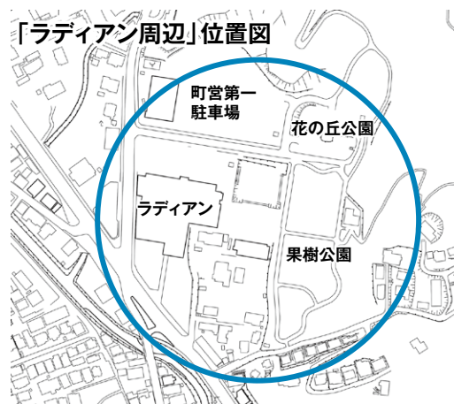
基本構想に位置づけた「ラディアン周辺」

建設場所は、広く「ラディアン周辺」として基本構想に位置づけ、浸水の可能性や地震に対するリスクなど、さまざまな災害を正しく評価し、非常時と日ごろの利便性をどう考えるか整理したうえで、新たな基本計画を作ることとしました。