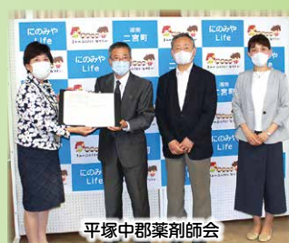
平塚中郡薬剤師会