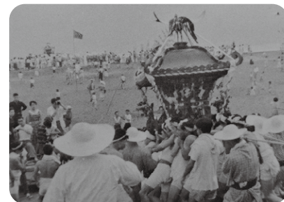
昭和30～40年頃の夏祭りの様子

夏に流行することが多い疫病を避けるため、7月に町の各地区でお祭りをやっていたんだね