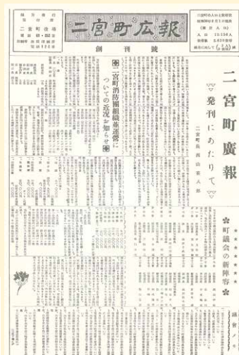
(広報にのみや 創刊号)