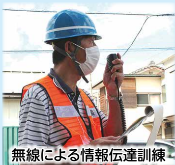
無線による情報伝達訓練

皆さんもご自宅や地域での災害時の行動を再確認し、いつ起きてもおかしくない災害に備えましょう。