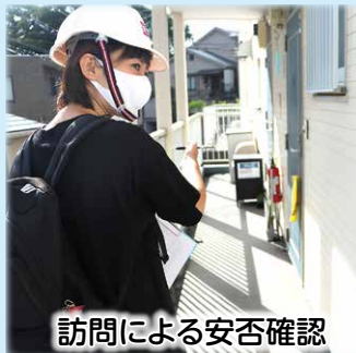
訪問による安否確認