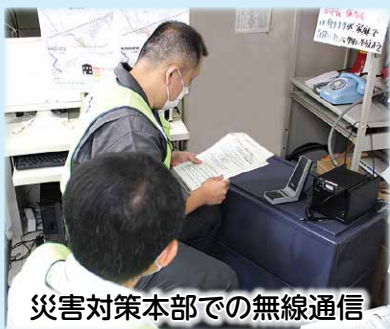
災害対策本部での無線通信