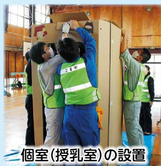
個室(授乳室)の設置