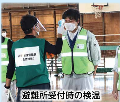
避難所受付時の検温