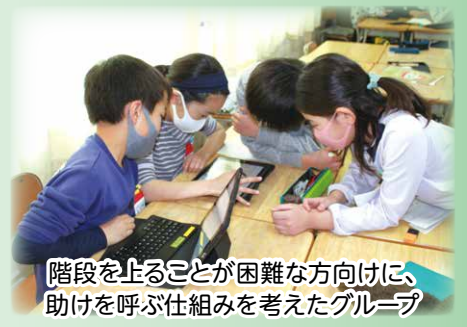
階段を上ることが困難な方向けに、助けを呼ぶ仕組みを考えたグループ

小学校ごとに、児童がさまざまなプログラミング教材を使って、身近な問題や課題を解決する仕組みを考えています。