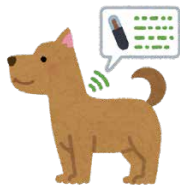
マイクロチップの装着も効果的です。

災害時の混乱の中では、ペットと離ればなれになってしまうことがあります。探すときや保護された場合に識別できるように鑑札・名札をつけましょう。