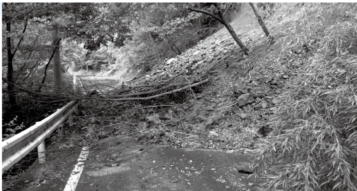
被害が発生する前に斜面の補修を行きましょう。