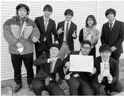
もりびとNOA(ノア) 活動開始：2019年～ メンバー：21～22歳の20人 もりびとNOA けんさく