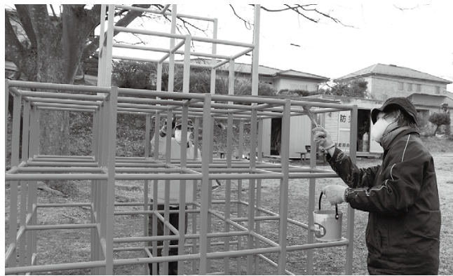
ジャングルジムの塗装作業