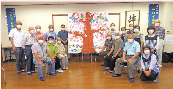
元町北地区のさくらプロジェクト。皆さん笑顔で和気あいあいと楽しく参加されていました。