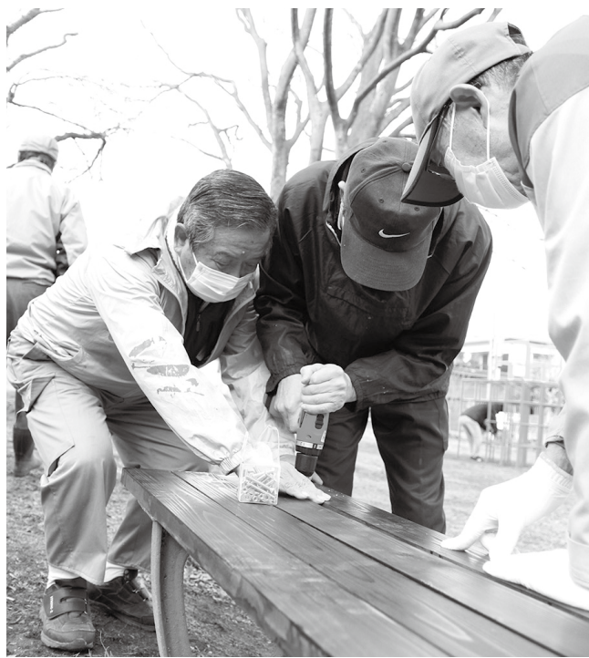
公園ベンチの張替作業

清掃だけでなくベンチの張替など、アイデアを出し合い、よりきれいな公園にしています。