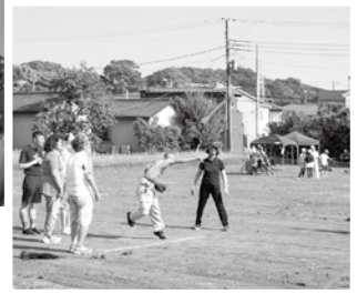
パラスポーツ競技練習 (東大跡パラスポーツの会)