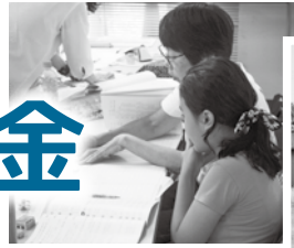
学習支援 (子ども学習支援『こむ』)