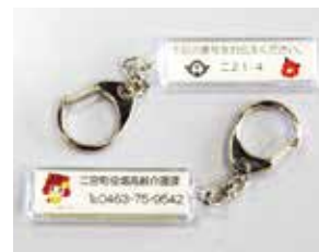
図 高齢介護課高齢福祉班(☎75-9542)

認知症などにより高齢者の方などが行方不明となった場合に早期発見できるよう、キーホルダーを配付しています。