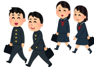
【通学時間の短縮に】