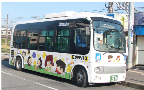
↑町コミュニティバス「にの♡バス」