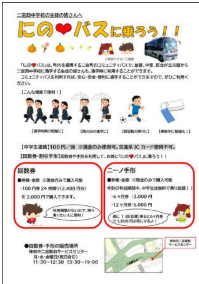
(2)二宮西中学校で配布したチラシ