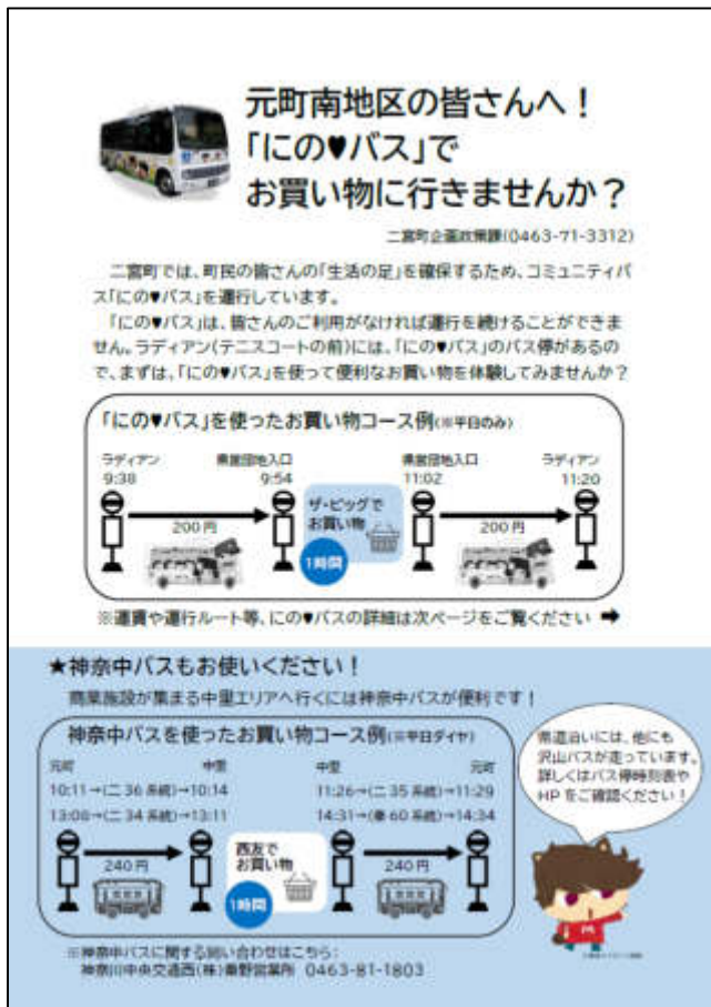
(1)「地域の通いの場」で配布したチラシ例