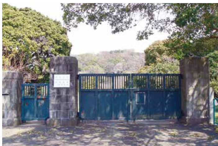
東京大学果樹園跡地