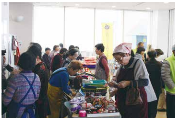
ふれあい福祉のつどい