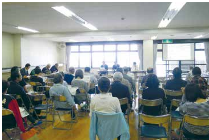
まちづくり移動町長室