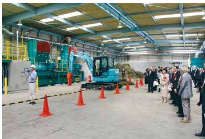
ウッドチップセンター