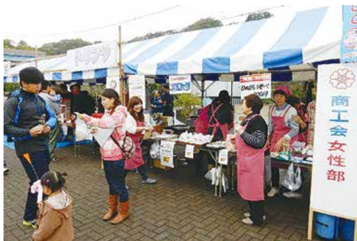
にのみや商工まつり