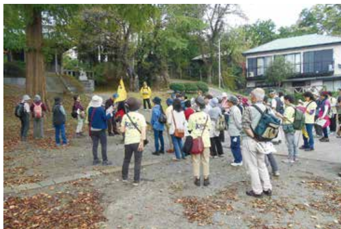
健康づくりウォーク