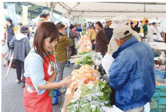
湘南にのみやふるさとまつり