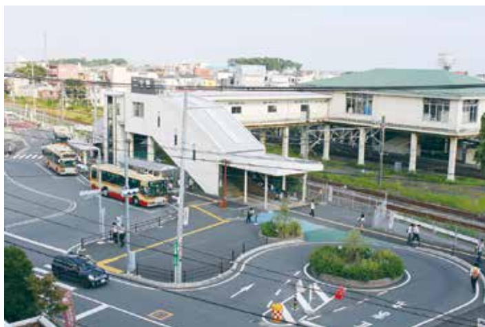
二宮駅北口駅前広場