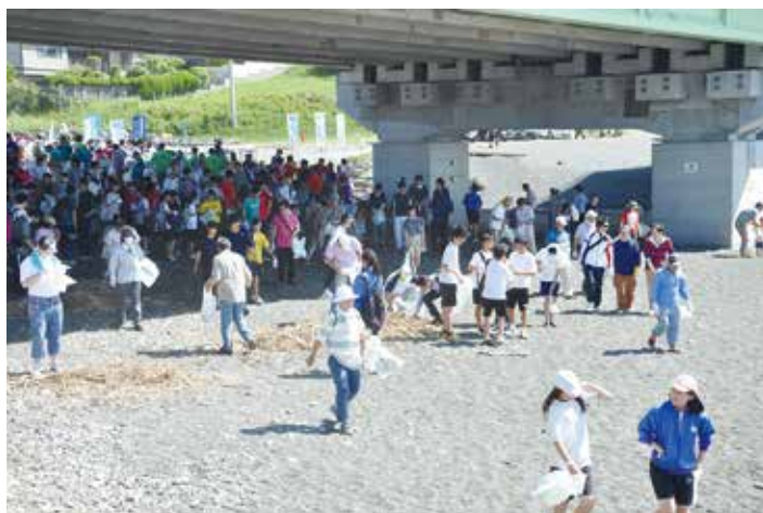
湘南にのみや海岸530キャンペーン