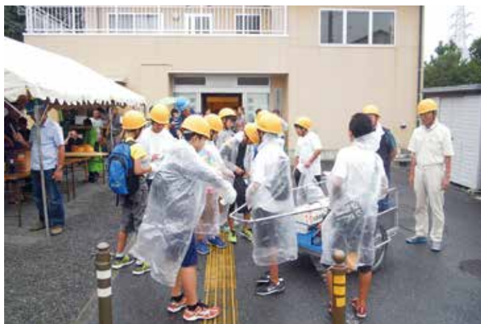
防災訓練に参加する中学生