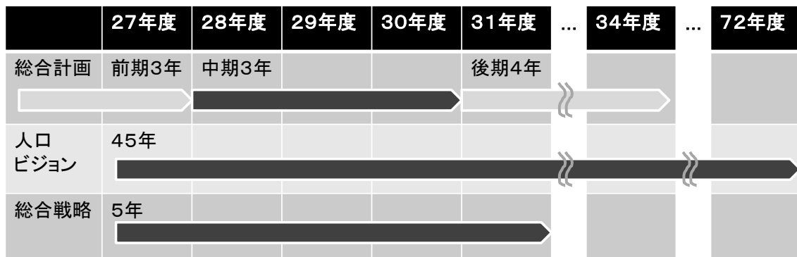
【二宮町総合戦略と二宮町総合計画及び二宮町人口ビジョンの計画期間】

ちなみに、第5次二宮町総合計画の計画期間は中期基本計画が平成28年度～30年度、二宮町人口ビジョンは平成27年度～72年度です。