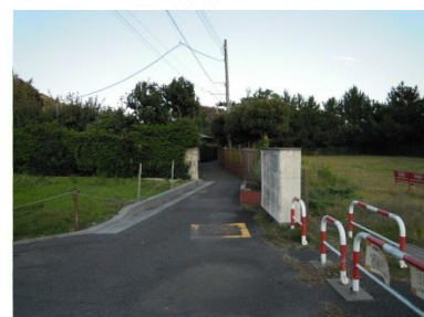
⑥東側隣地の状況(体育館方面)