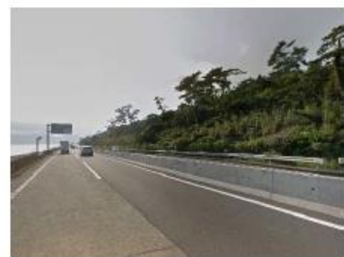
③西湘バイパスからの見上げ