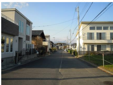
④国道1号からのアプローチ