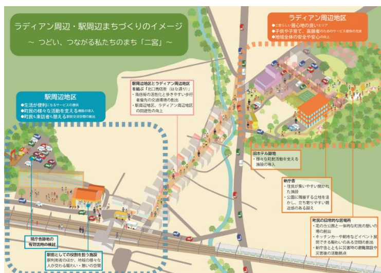
ラディアン周辺と駅周辺のイメージ図

令和3年度は、役場新庁舎の「基本計画」に相当する部分と、駅周辺の公共施設再編による複合施設の「基本構想」に相当する部分を合わせ、改めて「(仮称)新庁舎・駅周辺公共施設再編計画」として策定する予算が承認されました。災害対応や行政機能集約のためだけの新庁舎整備ではなく、二宮らしいあらゆる世代にとって居心地の良い場所とした、ラディアン周辺の拠点づくりと、老朽化が進む駅周辺の公共施設の再編により、町民の生活が便利になる場所、様々な活動を支える場所として、新たな駅周辺の拠点づくりの方向性について、将来イメージをお示した計画を策定しました。