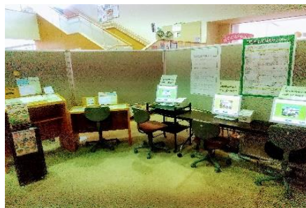
特設カウンターの様子