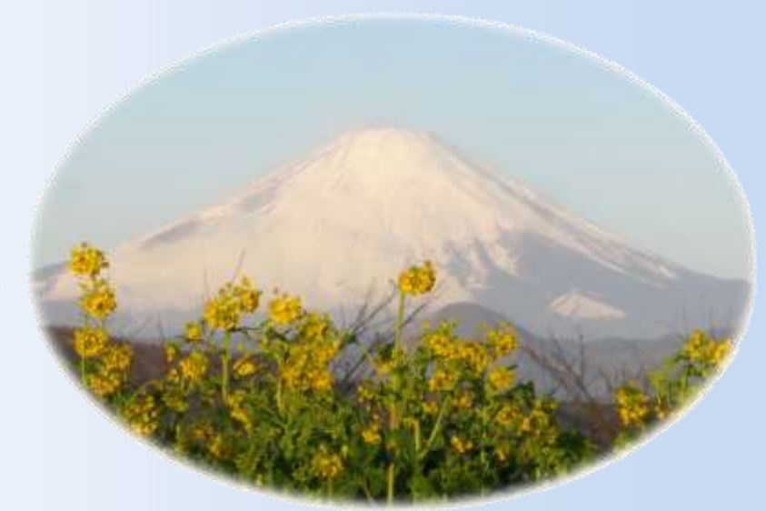
吾妻山公園からの富士山