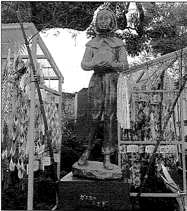
千羽鶴で飾られたガラスのうさぎ像