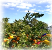
星椋学園さんでの農業体験