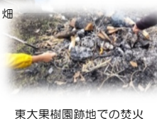
東大果樹園跡地での焚火