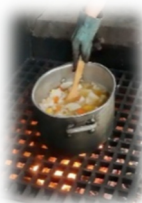
足柄ふれあいの村での野外炊事