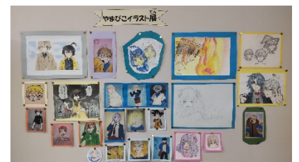
通室生の素敵な作品の数々