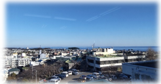
〈やまびこの教室から見える景色〉

全国的に不登校の児童生徒が増加傾向にある中、子どもたちの居場所づくり、学びの保障が求められています。二宮町にも、様々な理由で学校に登校できない子どもたちが、社会的自立を目標とし、自分のペースでゆっくりと学びを進めることができる教室「やまびこ」があります。「やまびこ」のパンフレットについては、にのみや学園内の各校に配架されている他、ホームページにも掲載されておりますが、具体的な活動内容について通信にて紹介します。 https://www.town.ninomiya.kanagawa.jp/cmsfiles/contents/0000000/936/yamabiko1.pdf