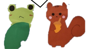
2023年度やまびこキャラクター のピピとココ (通室生考案)

やまびこについては、学校の先生にご相談ください。直接やまびこへお電話頂いても構いません。 (電話：0463-72-2883)