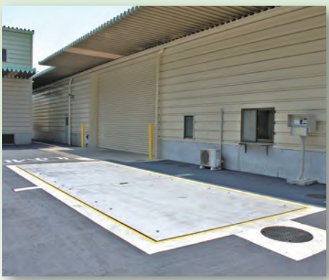
1 計量機 搬入された剪定枝の重さを計ります。