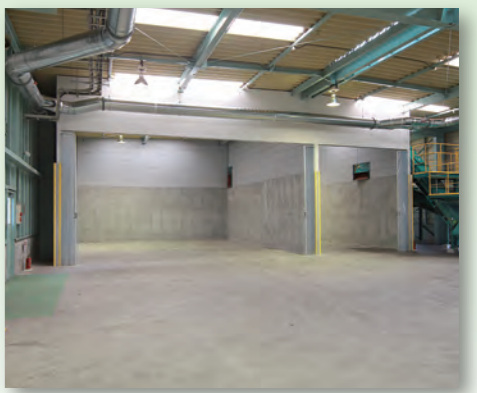
7 搬出物貯留ヤード 燃料用と堆肥用に分けたチップをためておき、発電燃料や堆肥原料としてリサイクルする施設に運びます。