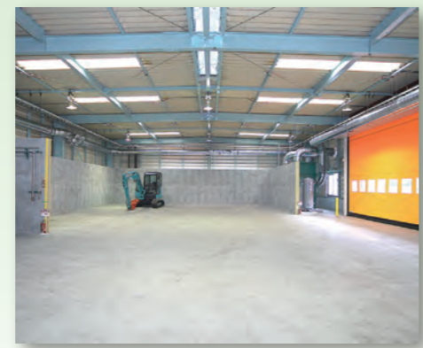
3 搬入物貯留ヤード 重さを計り終えた剪定枝を受け入れます。