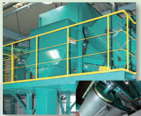
5 磁選機 チップの中から鉄類を取り除きます。