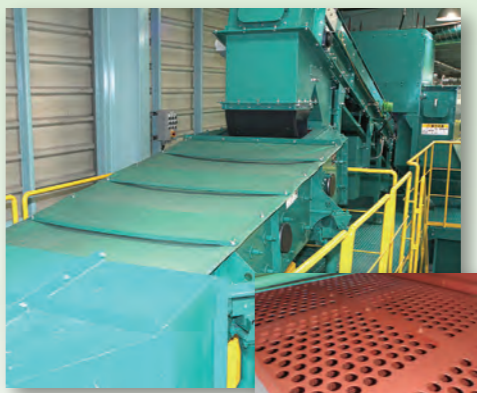
6 ふるい チップをふるいにかけて、大・中・小のサイズに分けます。大きいチップは、もう一度細かく砕き、中ぐらいのチップは燃料用、小さなチップは堆肥用になります。