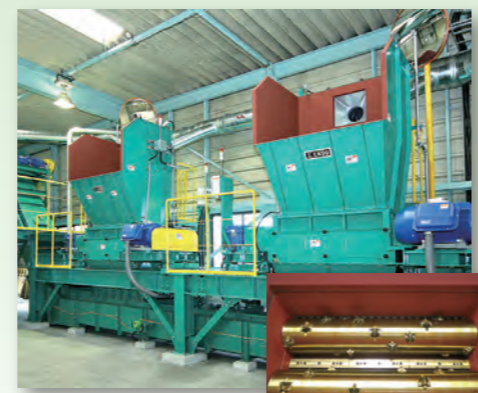
4 破砕機 剪定枝を約10cmの大きさまで細かく砕きチップにします。