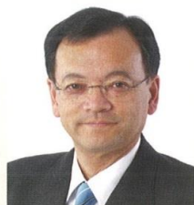
平塚市長 落合 克宏