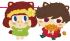
二宮町PRキャラクター「ニーノ・ミーヤ」

フォトラリーポイント…観光協会・吾妻山公園(管理棟)・吾妻神社・ガラスのうさぎ像・ラディアン花の丘公園・徳富蘇峰記念館・ふたみ記念館・川勾神社・湘南オリーブの郷・ユニバーサル農場眺望自由席・東京大学果樹園跡地・せせらぎ公園