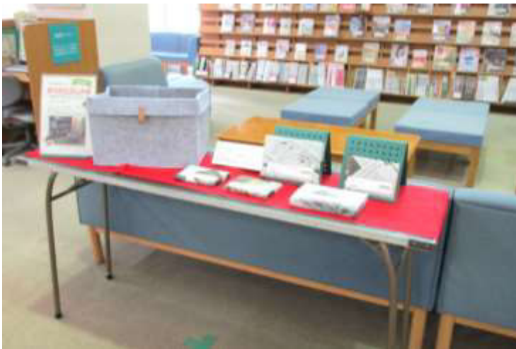
(「本のおたのしみ袋」の様子)